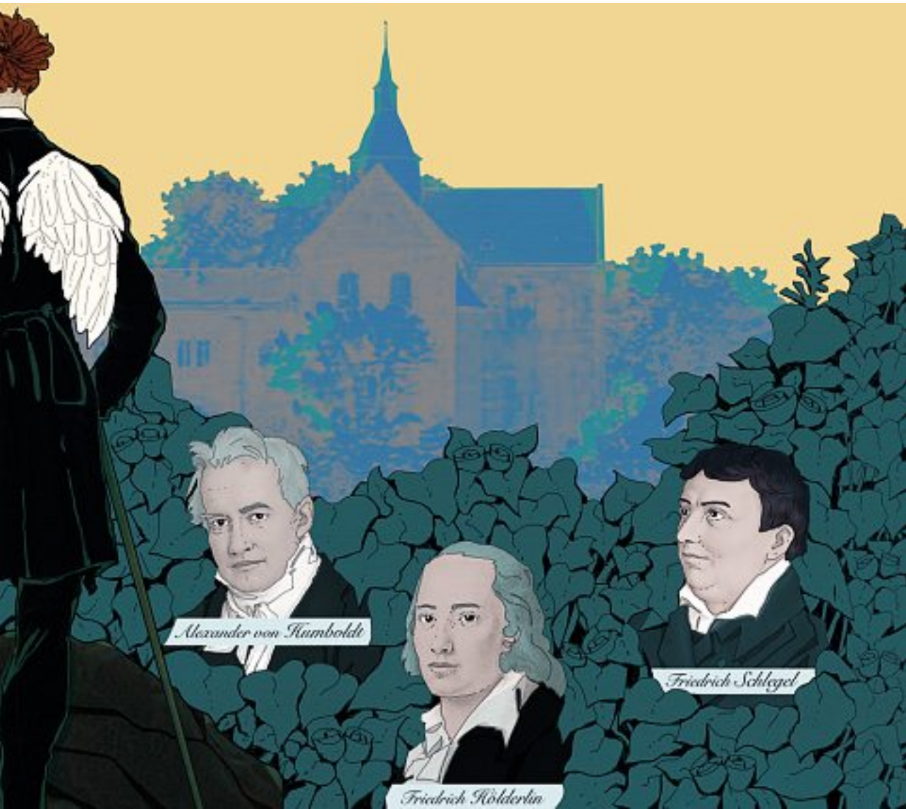
ILLUSTRAZIONE DI FABIO DELVÒ

versione inquietante della figura della spia: tra borghesi ipocriti e anarchici inutili, non si salva nessuno, e non c'è una «parte giusta» da cui stare. Ci consoliamo perché si tratta di un «racconto ironico». Ma l'amaro resta.